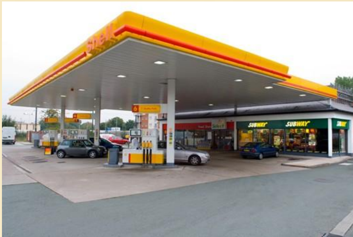
Shell, Salford, GB (Int. Et Ext.)