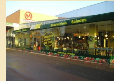
Partenariat avec une salle de cinéma