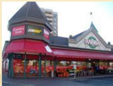
Partenariat avec une chaîne de restaurant