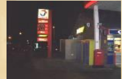
Partenariat avec un pétrolier