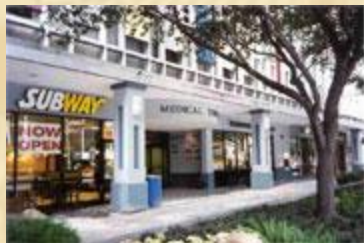
Partenariat avec un hôpital