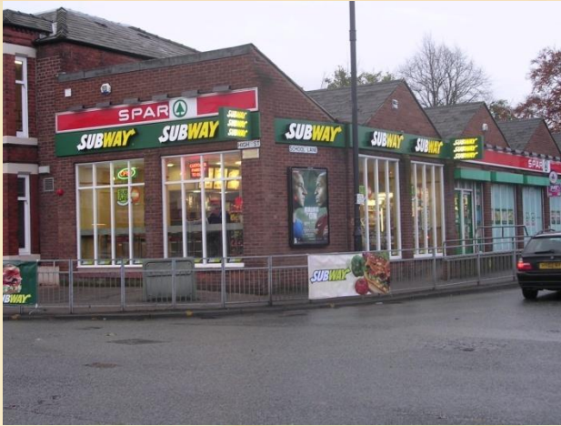
SPAR, Wigan, GB