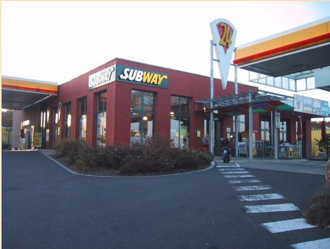
Shell, Hausen-Erbshausen, Allemagne