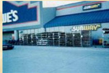
Partenariat avec une chaîne d'hypermarchés