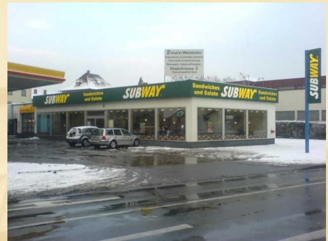
Shell, Weinheim, Allemagne