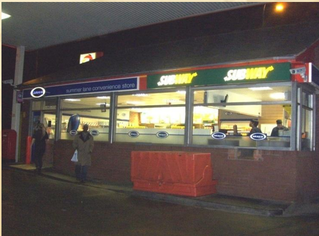
Total, Birmingham, GB