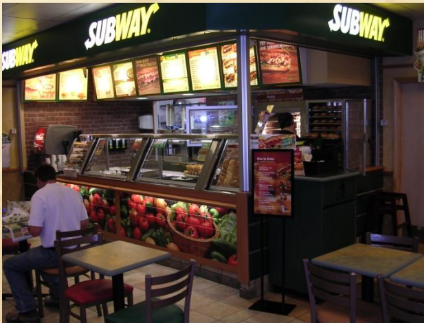
BP, Manchester, GB (Intérieur)