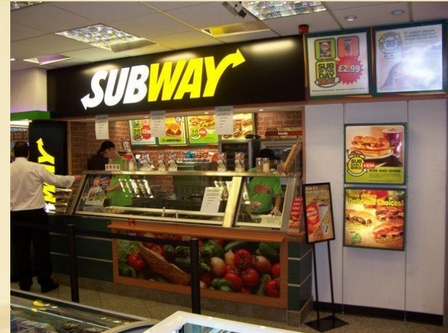
SPAR, Templepatrick, GB