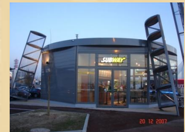
Un bâtiment Solo en France