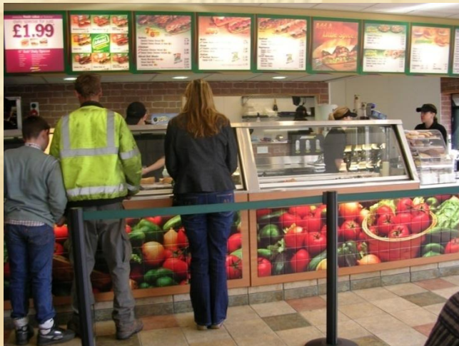
SPAR, Belfast, NI UKM