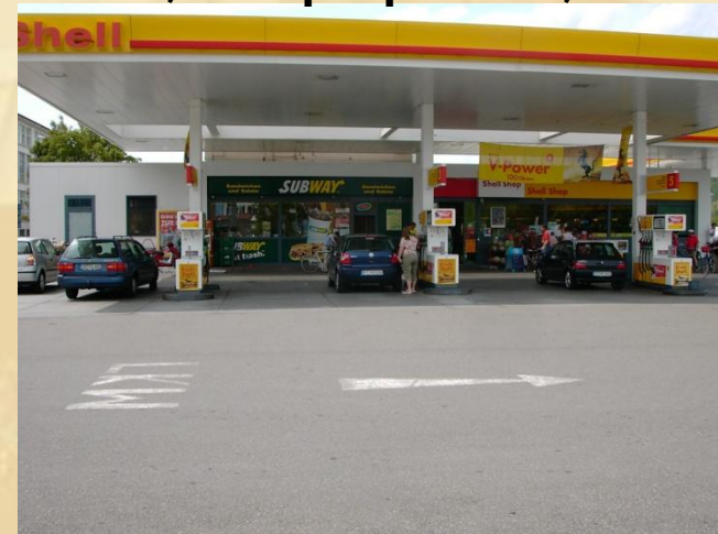
Shell, Kirchentellinsfurt, Allemagne