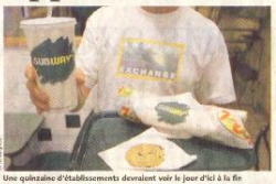
Une quarantaine d'établissements devaient voir le jour d'ici la fin du premier trimestre 2008.