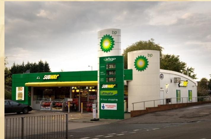
BP, Manchester, GB (Extérieur)