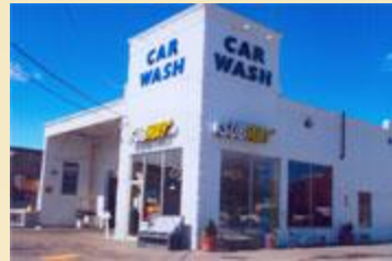
Partenariat avec une station de lavage