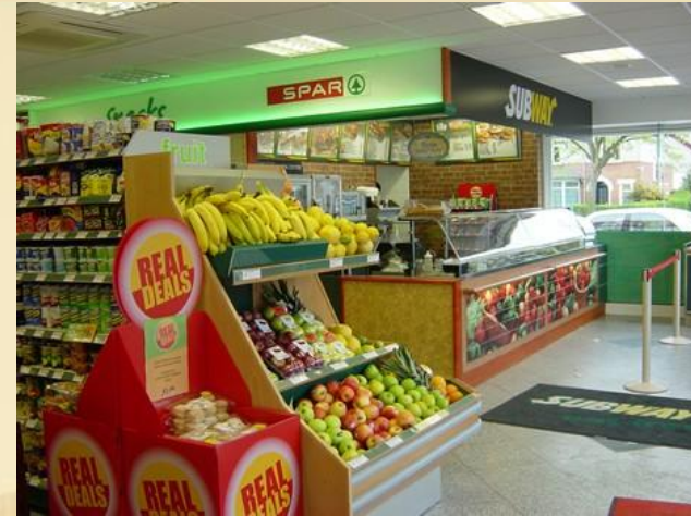
SPAR, Belfast, GB