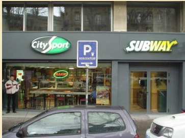
Partenariat avec Citysport