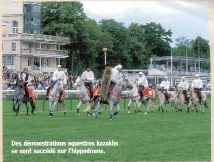
Des démonstrations équestres kazakhs se sont succédé sur l'hippodrome.