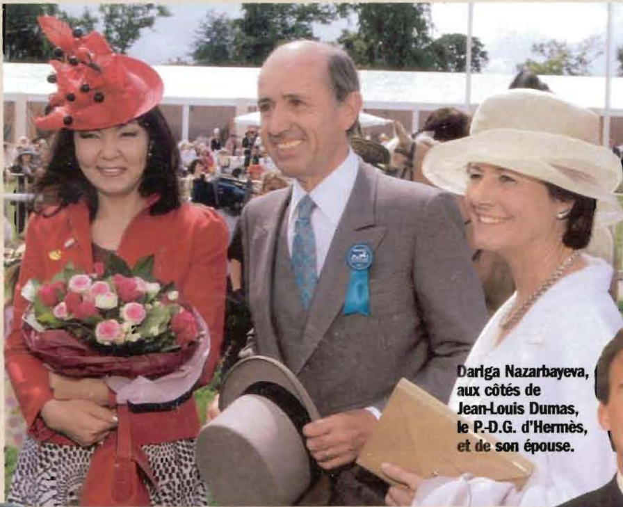
Dariga Nazarbayeva, aux côtés de Jean-Louis Dumas, le P.-D.G. d'Hermès, et de son épouse.