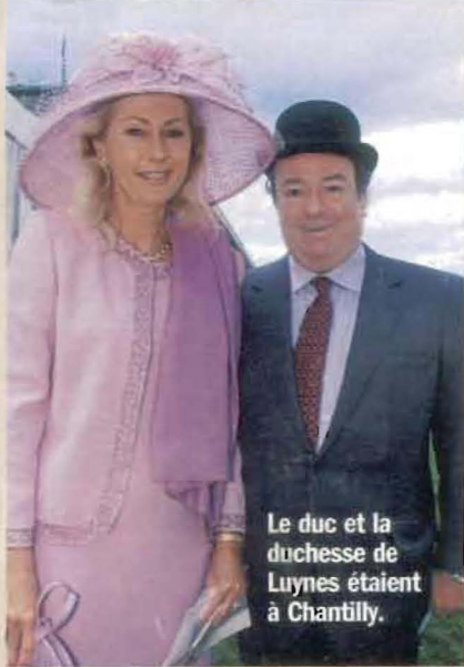
Le duc et la duchesse de Luynes étaient à Chantilly.